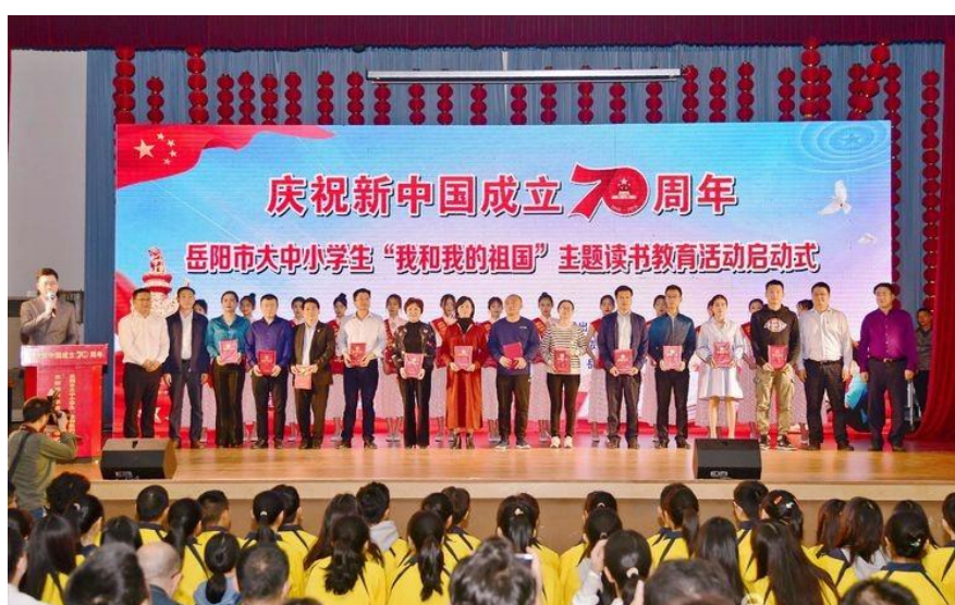
新中国成立 70 周年主题读书教育活动