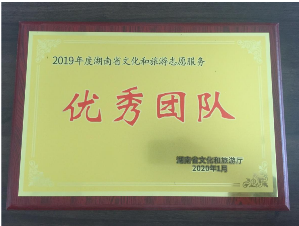
2019年度湖南省文化和旅游志愿服务“优秀团队”