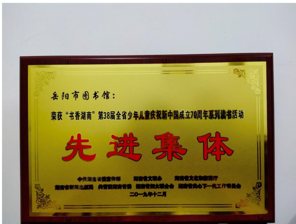
“书香湖南”活动先进集体