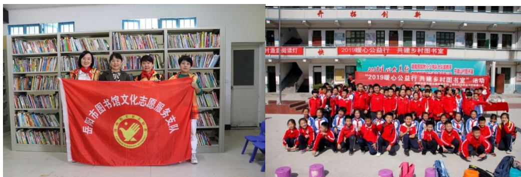
暖心公益行，共建乡村图书室